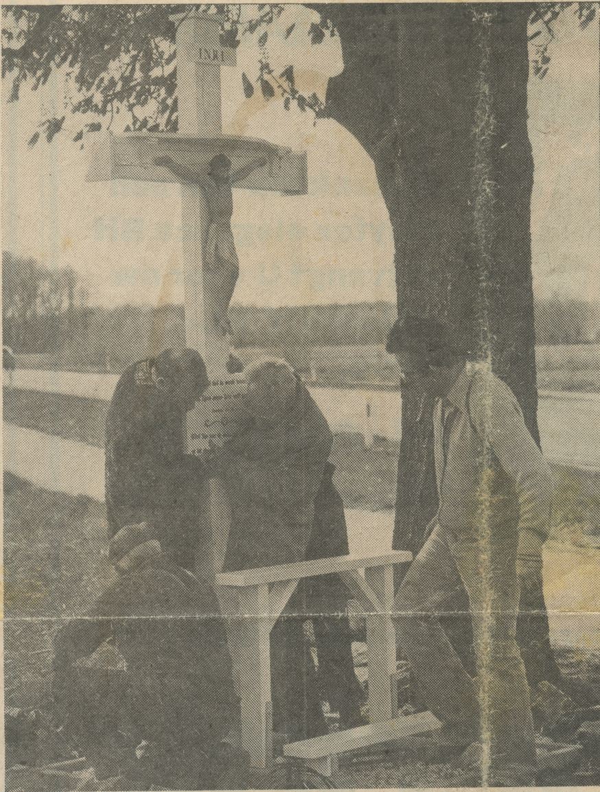
NIEUW KRUIS AAN DE LEMMENWEG-DEURNESEWEG

ze onderling toch zeer veel, ook al vanwege de afwijkende hoogten, maar ook door de verschillende artistieke aspiraties die de makers in hun werk leggen. Van massa-productie is dus beslist geen sprake.