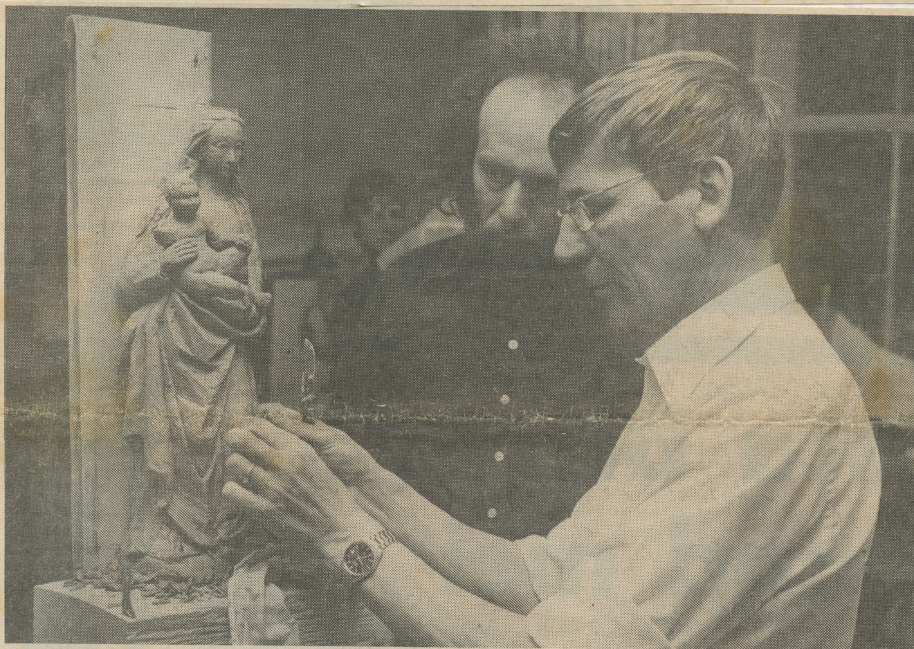
NIEUWE BEELDEN VOOR DE VENRAYSE VELDCAPELLEN

Inderdaad, dat kan men wel zeggen de Werkgroep Kruisen en Kapellen van Veldeke Venray timmert volop aan de weg. Zoals aangekondigd, werd vorige week zaterdag op de hoek Lemmenweg-Deurneseweg een nieuw kruishout geplaatst, ter vervanging van een betonnen kruis, dat wellicht elders in onze gemeente heropgericht zal worden.