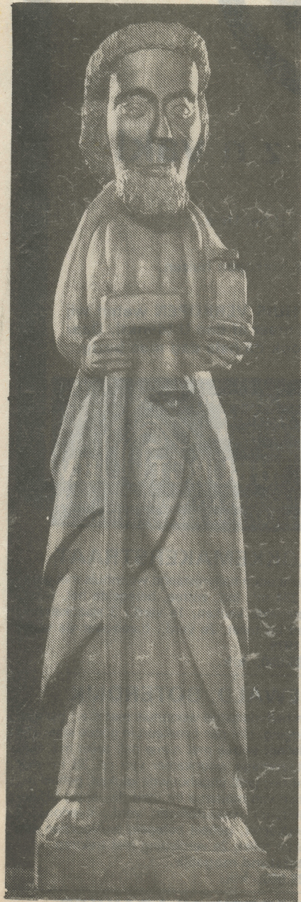
Sint Antonius Abt weer terug in muurkapel aan de Hiept