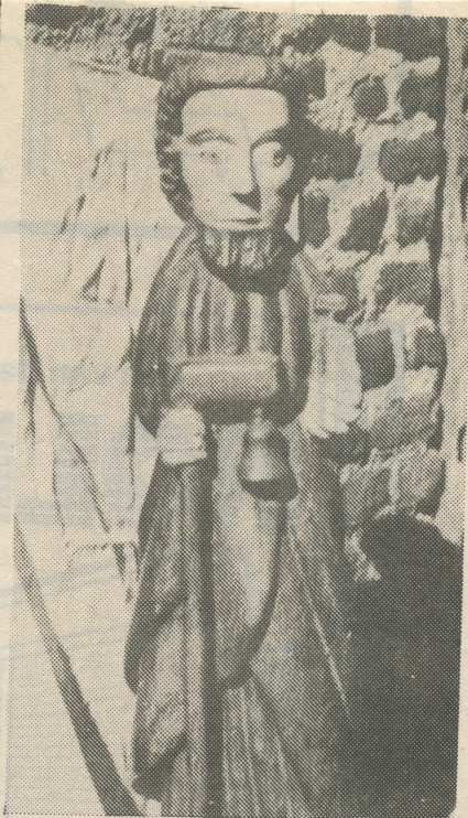
ST. ANTONIUS ABT

De Werkgroep Kruisen en Kapellen van Veldeke Venray is met deze toezegging zeer gelukkig, omdat daardoor een kapelletje kan worden opgeknapt dat dringend aan een grondig herstel toe is, maar nog niet paste in het herstelschema dat de Werkgroep heeft samengesteld. Want het is wel zo, dat nog regelmatig giften voor herstel van kruisen en kapellen binnenkomen, waarvan men ook een reserve-potje kan maken voor de komende jaren, maar dat het renoveren van deze Venrayse monumentjes toch steeds een kwestie blijft van veel vrijwilligerswerk.